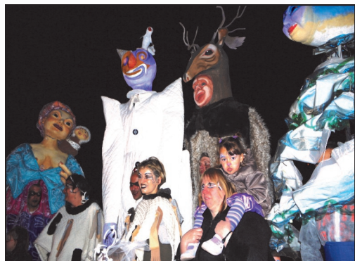
Photo : Carnaval des 3 Cités, Mars 2012

La date est fixée au Vendredi 15 Mars, c'est encore loin mais les préparatifs sont déjà enclenchés.