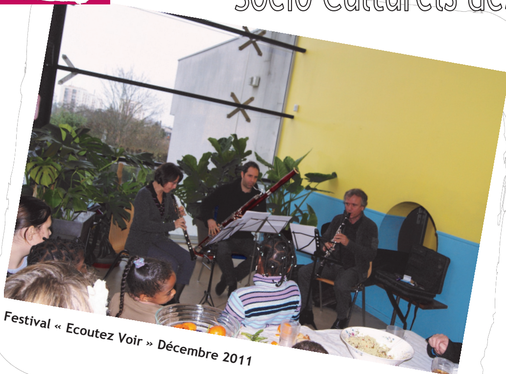
Festival « Ecoutez Voir » Décembre 2011

de l'Association des Centres SOCIO CULTURELS des 3 Cités