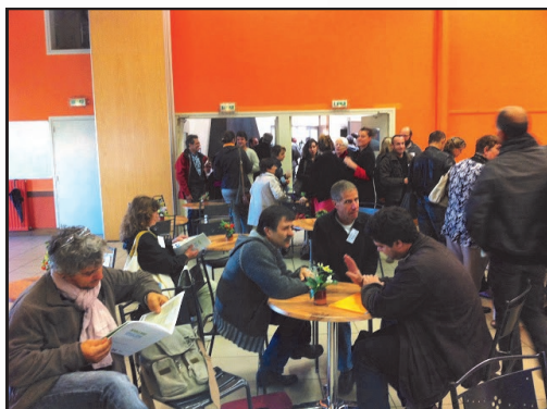
Photo : Journées régionales Centres sociaux Poitou-Charentes 2012

Du 21 au 23 juin 2013, entre 2500 et 3000 personnes issus des 1200 centres sociaux et socio-culturels de France vont se retrouver à Lyon pour se retrouver, réfléchir ensemble et partager des temps conviviaux. Le vendredi sera consacré à comprendre, se former, s'informer sur les 7 questions sociales qui sont issues de la récolte des indignations faite en 2011 : le logement, la précarité, l'isolement social, la santé, l'éducation, la citoyenneté, la discrimination. Au regard des questions sociales qui préoccupent les habitants, de l'essoufflement des politiques publiques en matière de participation, les centres sociaux revendiquent que les habitants aient une véritable place, soient en capacité d'agir pour infléchir des choix faits pour eux. Le samedi sera consacré à cette question du pouvoir d'agir des habitants. Le dimanche matin lancera cette nouvelle dynamique avec en perspectives, le congrès du centenaire de la fédération en 2022.