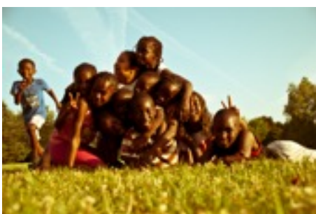
Association des Centres Socio-Culturels des 3 Cités