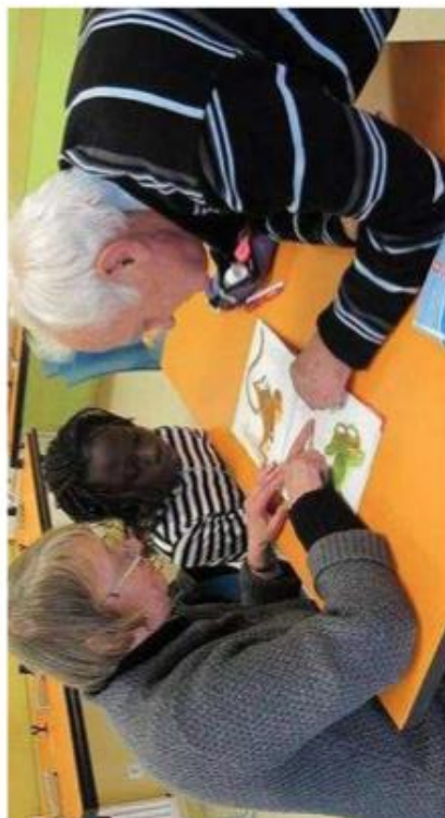
Des étudiants et des enseignants à la retraite s'investissent dans l'accompagnement scolaire individualisé des adolescents.