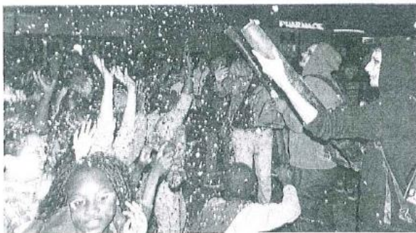
Les souffleurs de confettis, s'en sont donné à cœur joie.