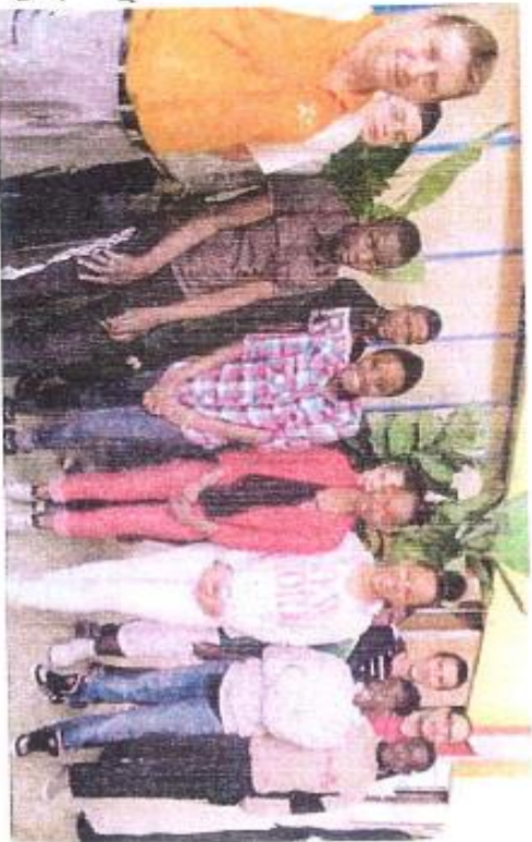
Une partie du groupe des jeunes avec leurs accompagnateurs.