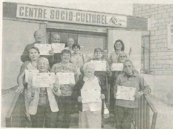
Les nouveaux secouristes du quartier des Trois-Cités.

« Un sens citoyen à souligner », témoigne l'animatrice. Deux sessions sur deux demi-journées étaient organisées en mai et juin dernier au CSC, en partenariat avec le service départemental d'incendie et de secours de la Vienne. La dernière formation de ce type remonte à 2011. Neuf secouristes avaient alors été formés. La