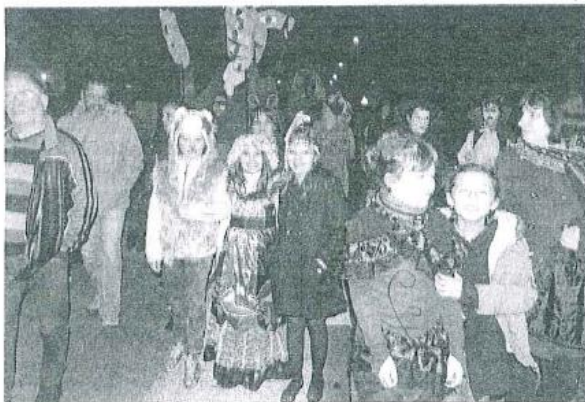
Il y avait du monde vendredi soir dans la rue.