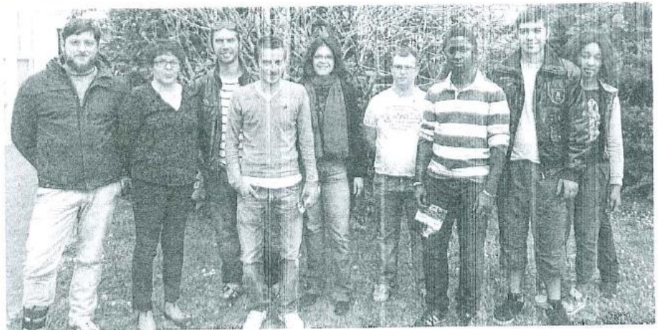
Les jeunes bénéficiaires, entourés des professionnels.

Difficile de dire si la démarche portera ses fruits. Une chose est sûre, dans trois semaines, les premiers patrons recevront