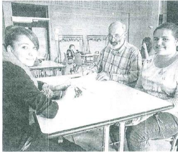
Assiduité et application pour un temps d'apprentissage volontaire

Les six bénévoles ont proposé des épreuves de français, math, histoire-géo, physique-chimie et anglais dans les mêmes conditions de passation qu'à l'examen : étiquette sur la table, pièce d'identité, renseignement du bordereau de copie, sans oublier le facteur temps. « De quoi apprendre à gérer le stress », stipule Nicolas, animateur du secteur jeunes au CSC. Une deuxième séance consistera à reprendre l'épreuve en petits groupes pour travailler au plus près des difficultés rencontrées par les jeunes. « Ils doivent se sentir