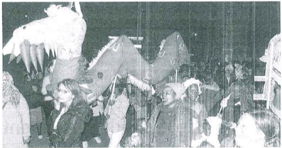
Le dragon avait effectivement les crocs.

C'était carnaval aux Trois-Cités vendredi soir. Cette année, il avait pour thème « les crocs ». Alors forcément, les organisateurs étaient sur les dents pour canaliser une foule s'étalant sur plusieurs centaines de mètres. Le centre socio-culturel, l'école Tony-Lainé, le centre d'animation de Fontaine-le-Comte travaillaient à la préparation de la fête depuis des jours. Les loups étaient partout. Les grosses têtes ont eu du succès. Hélas, à l'exception de Dracula, plutôt courtois ce jour-là et du gentil dragon, elles ont fini sur le bûcher, place Moundou.