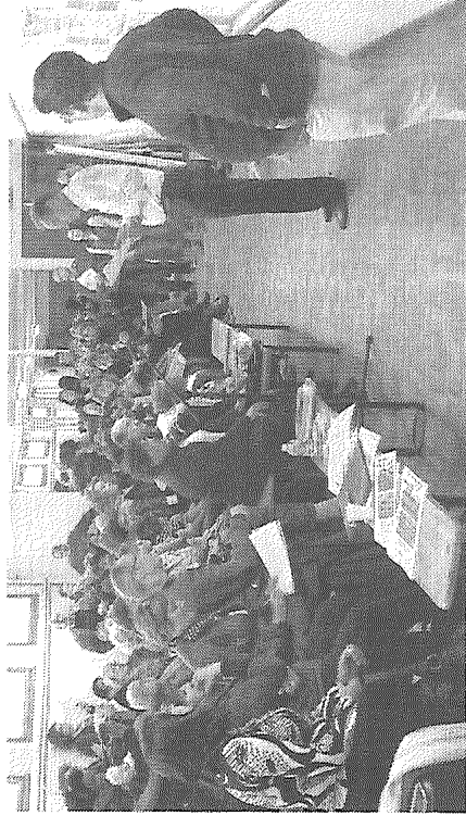
Les habitants ont répondu massivement à l'invitation.

« De la matière pour les 20 prochaines années », souligne Vin-