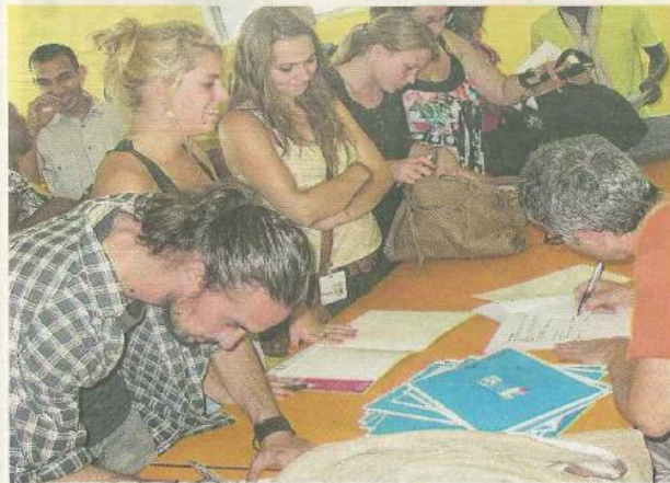
De jeunes animateurs signent leur contrat avec le Groupement des employeurs des associations.

Elle fait partie des 42 animateurs qui ont été recrutés soit