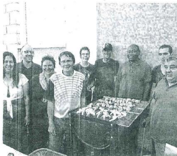
Les organisateurs du premier barbecue des familles ont tout prévu y compris la bonne humeur.

Une centaine d'habitants des Trois-Cités a fait la fête vendredi soir au Clos Gaultier. Une façon de clôturer l'année scolaire en beauté. Une fête comme on les aime, généreuse, conviviale et sans microche. Une fête familiale sous forme de barbecue, la première du genre, organisée par un groupe d'habitants au profit des familles dont les enfants sont accueillis dans le cadre périscolaire au centre de loisirs des CSC des 3-Cités. Dans la foulée, nombre d'entre eux ont rejoint le parc du Triangle d'Or pour assister au premier concert « Bistrot de l'été ». Une sympathique représentation de la compagnie « Les pompes en l'air ». L'occasion d'innover le premier bar itinérant, sans alcool évidemment, décoré par les habitants du quartier. Cerise sur le gâteau, le feu d'artifice. Celui-là même qui un mois plus tôt,