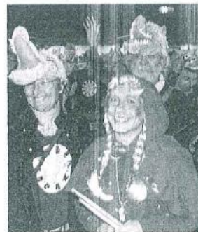
Les percussionnistes de Baturcabraz ont lorgné toute la soirée sur le petit chaperon rouge.