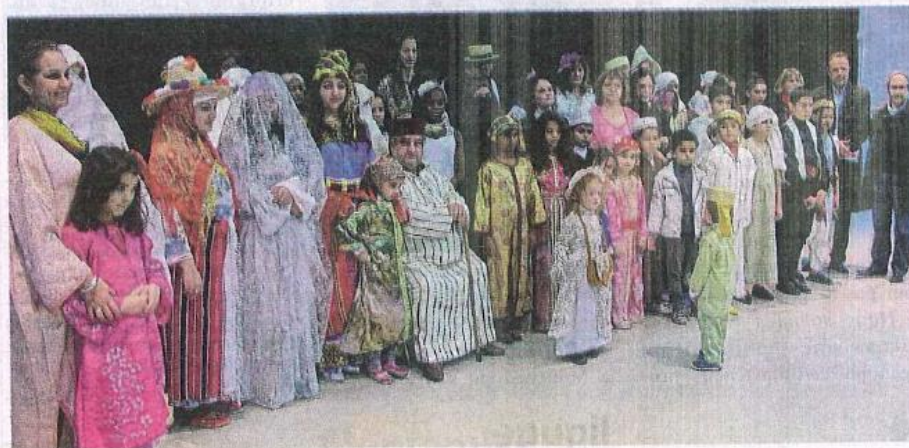
La répétition générale a mobilisé une cinquantaine d'habitants, de tous âges et de toutes origines.

Cette animatrice du Toit du Monde est à l'origine de ces échanges qui ont mobilisé depuis deux mois une cinquantaine d'habitants pour les préparatifs et les répétitions. La Croix-Rouge et Emmaüs ont fourni un complément de vêtements et d'accessoires, en plus de ceux fournis par les habitants. Les mannequins bénévoles seront à l'image de la diversité culturelle de la cité.