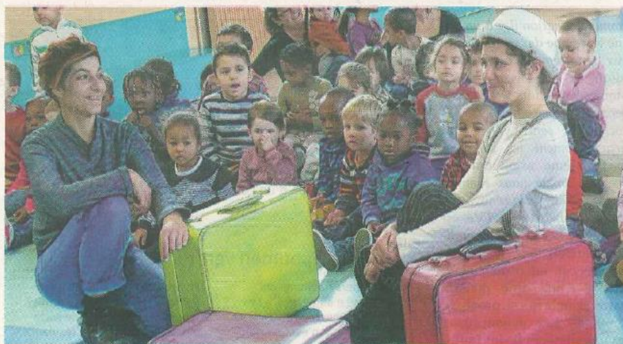
Après leur représentation, les danseuses de la compagnie La Suerte ont discuté avec les enfants.

Écoutez donc voir des amateurs, des élèves du conservatoire et des professionnels,