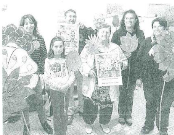
Un bouquet d'animations en perspective.

> Dès midi. Les visiteurs auront la possibilité de se restaurer sur place ou encore d'apporter leur pique-nique. Des animations seront proposées en continu de 14 h à 18 h. Un espace seniors, un concert, des balades en calèche, de l'orgue de barbarie, des manèges, du foot, un cabaret d'im-